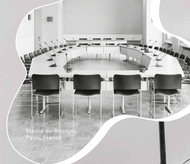
Mairie du Bourget, Paris, France

Depuis le début des années 1920, HOWE crée un mobilier flexible au design innovant et de faible encombrement. Cela tombait à point nommé pour répondre aux impératifs d'encombrement de la US Navy pendant la Seconde Guerre Mondiale ; c'est pour sa flotte de sous-marins qu'HOWE a conçu à l'époque la légendaire table Victory. Le faible encombrement et la flexibilité sont demeurés une constante de la création chez HOWE et bien des années plus tard, en 1974, HOWE a utilisé la même recette pour lancer la table Tempest. La Tempest est devenue une référence industrielle pour les tables abattantes : grande qualité, robustesse et polyvalence étonnante. C'est encore aujourd'hui la table la plus vendue de HOWE.