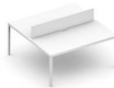
Composizioni. Configuration. Compositions. Konfigurationen. Composiciones. Копозиции.

Flessibilità ed eleganza pura per Frame + Operative, un progetto trasversale che introduce nell'ufficio operativo un nuovo livello di estetica, risolvendo le più diverse esigenze di spazio e di lavoro. I tavoli, contraddistinti dal telaio perimetrale con piano integrato, possono essere attrezzati con schermi separatori e completati con cassettiere, porta CPU ed altri accessori.