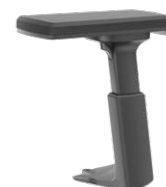
Accoudoirs en T 3D, noirs