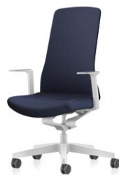
Siège pivotant Dossier rembourré

PURE IS3 s'adapte parfaitement à chaque environnement. Son design clair et le vaste choix de couleurs et de tissus offrent une grande marge de manœuvre en ce qui concerne la configuration individuelle. La collection englobe quatre modèles de sièges pivotants : dossier résille ou rembourré, en blanc ou noir. Il est également possible de choisir parmi une multitude de matériaux et de couleurs. Pour chaque modèle, le Smart Spring, les colonnes et les accoudoirs en option se déclinent dans un coloris uniforme blanc ou noir. Sont disponibles au choix des accoudoirs en T fixes ou des accoudoirs en T 3D. Les accoudoirs en T fixes séduisent par leur design élancé, tandis que les accoudoirs en T 3D convainquent par leur caractère fonctionnel et les possibilités de réglage en hauteur, en largeur et en profondeur.