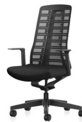
Siège pivotant Dossier résille