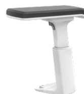
Accoudoirs en T 3D, blancs