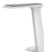
Accoudoirs en T fixes, blancs