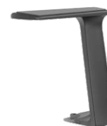
Accoudoirs en T fixes, noirs